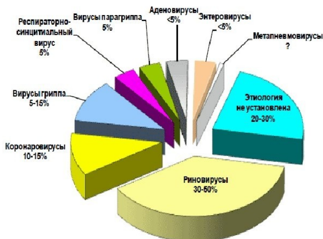
Рисунок 1. Этиологическая расшифровка возбудителей ОРВИ.

Известно более 200 вирусов, которые способны вызывать поражения респираторного тракта. К наиболее распространенным возбудителям ОРВИ относятся: вирус гриппа, вирус парагриппа, респираторно-синцициальный вирус, аденовирус, риновирус, бокавирус, метапневмовирус, коронавирус, энтеровирусы (рис. 1).